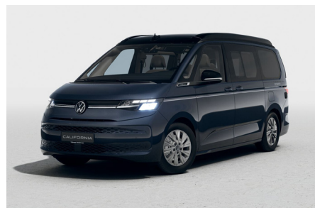
Starlight Blue Metallic