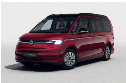
Fortana Red Metallic