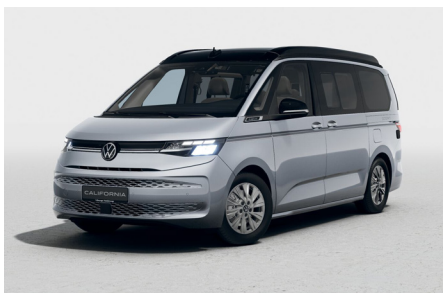
Mono Silver Metallic