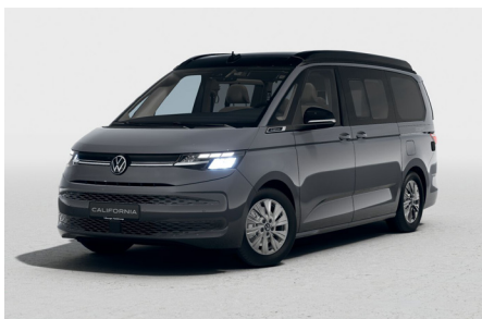
Indium Grey Metallic