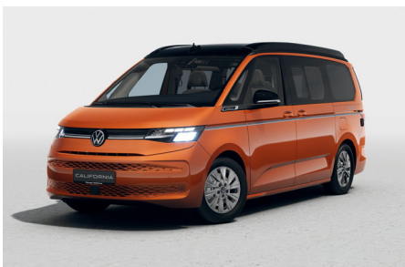
Energetic Orange Metallic