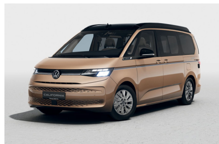
Copper Bronze Metallic